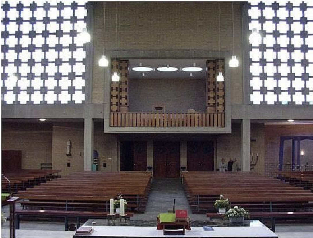
Zicht op de zangtribune